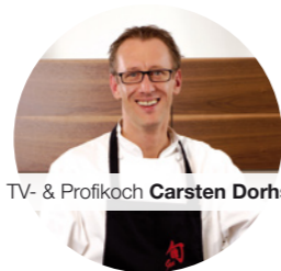
TV- & Profikoch Carsten Dorhs

Kochen Sie mit Carsten Dorhs in der Kochschule la cucina in Remagen am Rhein. Kochen und Essen sind ein wichtiger Teil des Lebens. In der la cucina Kochschule nehmen Sie in einer lockeren Atmosphäre und tollem Ambiente an Tipps und Tricks aus der Profiküche teil. (Info: www.carsten-dorhs.de )